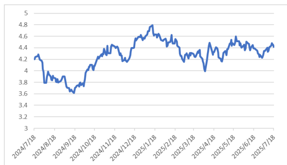
10 年期美債息走勢圖：