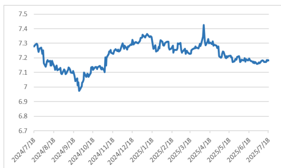
美元兌離岸人民幣走勢圖：