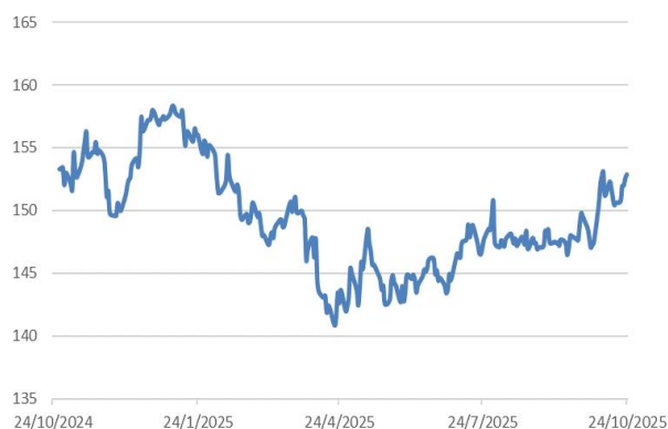
美元兌日圓走勢圖：