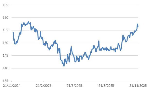
美元兌日圓走勢圖：