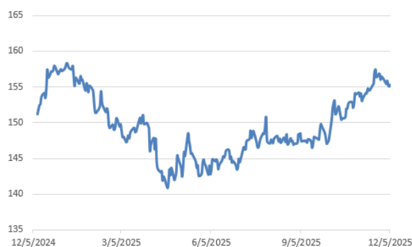
美元兌日圓走勢圖：