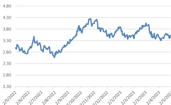
10年期美債息走勢圖：