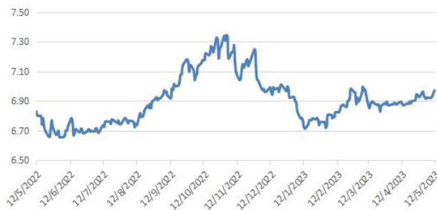
美元兌離岸人民幣走勢圖：