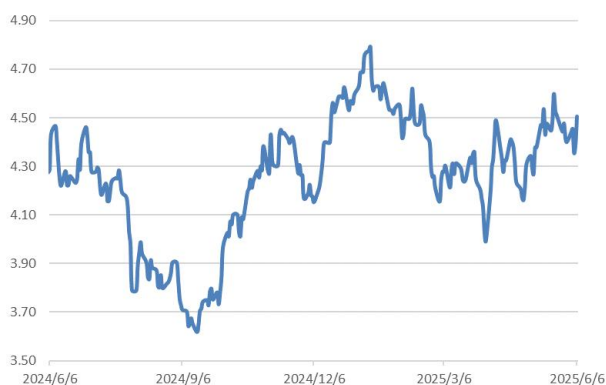
10 年期美債息走勢圖：