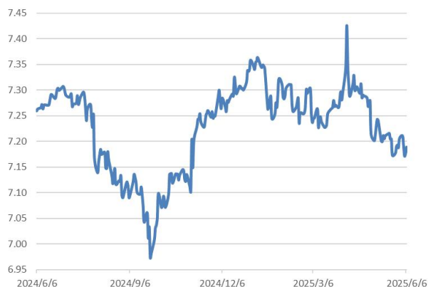
美元兌離岸人民幣走勢圖：