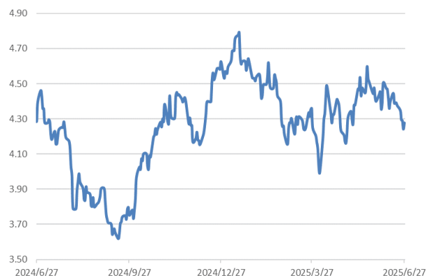
10 年期美債息走勢圖：