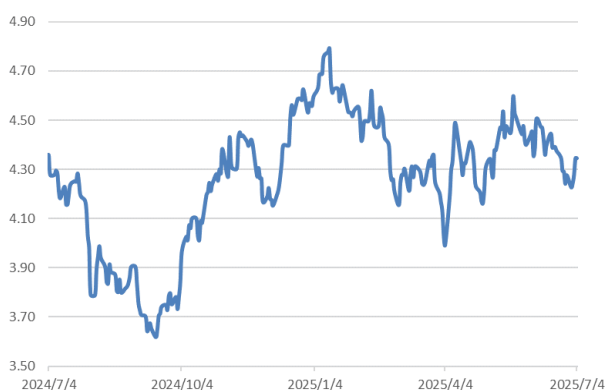
10 年期美債息走勢圖：