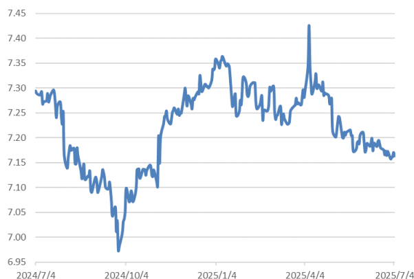
美元兌離岸人民幣走勢圖：