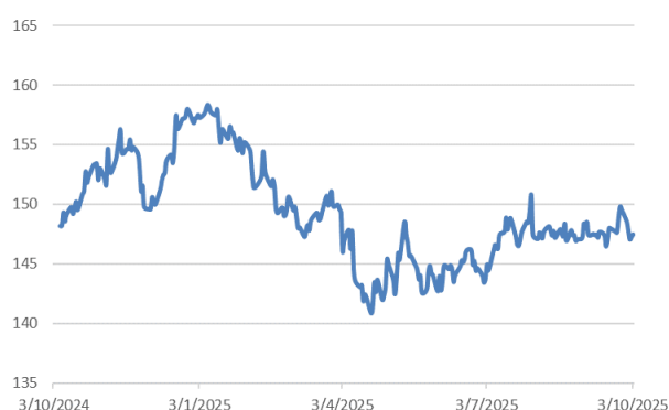
美元兌日圓走勢圖：