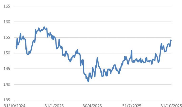
美元兌日圓走勢圖：